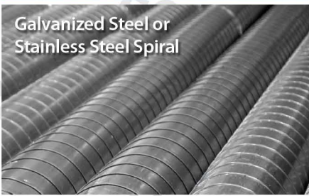
Galvanized Steel or Stainless Steel Spiral